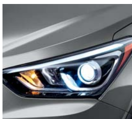
(IM) Gris Mineral