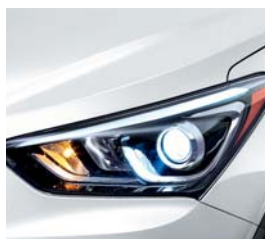
(SWP) Blanco Aperlado