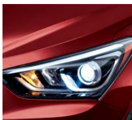
(TR3) Rojo Serrano